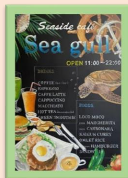
シーサイドカフェ シーガル

注)・新型コロナウイルス感染拡大防止の為、来館前は検温して、マスク着用でお越しください。 感染の状況に応じて、中止する場合があります。